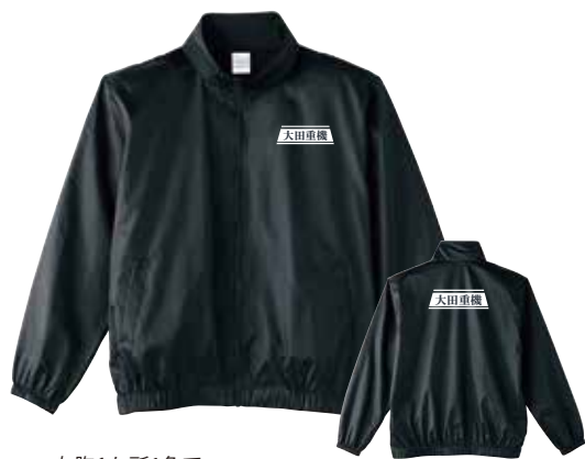
左胸1か所1色で 40枚注文した場合：1枚あたり2,330円(税込)

イベントなどで大活躍のナイロンブルゾン。袖と裾はゴム仕様で風を通しにくく、生地は異形糸タフタで光沢感を美しく演出しております。