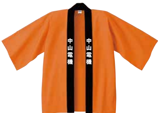
胸1か所1色で 40枚注文した場合：1枚あたり2,410円(税込)