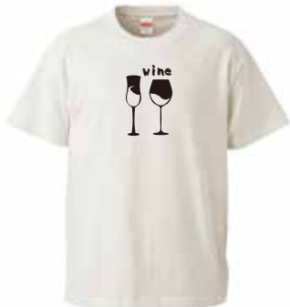
胸1か所1色で 40枚注文した場合：1枚あたり1,220円(税込)