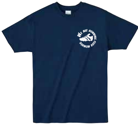
左胸1か所1色で 40枚注文した場合：1枚あたり1,040円(税込)