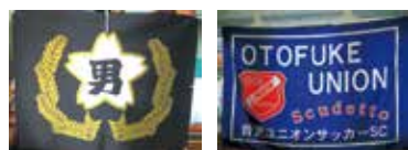
横断幕 (縫製代別途)